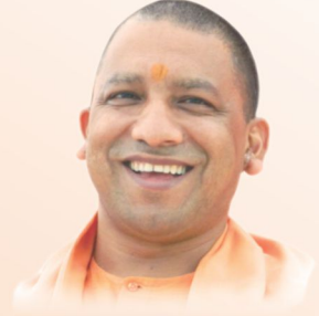
योगी आदित्यनाथ मुख्यमंत्री, उत्तर प्रदेश

स्वयं और परिवार को डेंगू, मलेरिया और चिकनगुनिया से बचायें