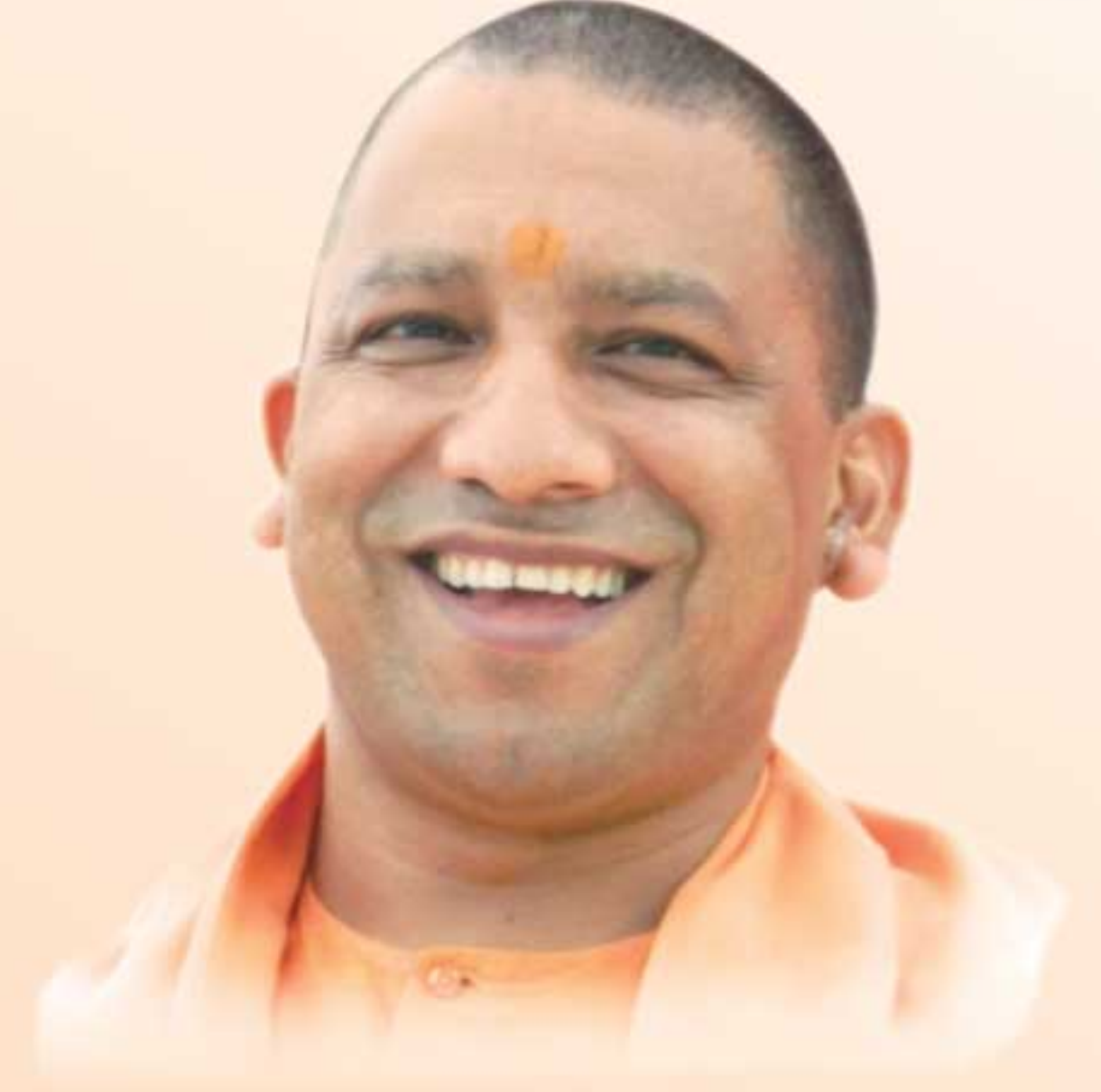
योगी आदित्यनाथ मुख्यमंत्री, उत्तर प्रदेश

स्वयं और परिवार को डेंगू, मलेरिया और चिकनगुनिया से बचायें