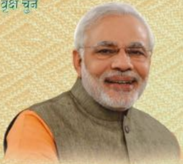
नरेन्द्र मोदी प्रधानमंत्री