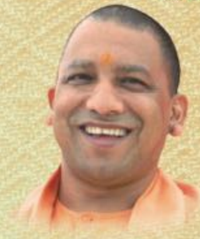
योगी आदित्यनाथ मुख्यमंत्री, उत्तर प्रदेश